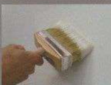
Mano di fondo con Smart Coat grana Extrafine Prime coat with Smart Coat Extrafine grain

Dopo la stesura di EVENTI a pennello, decorare con apposito "art-spatula" con piccoli movimenti circolari. After applying EVENTI by brush, use the special "art-spatula", brushing the surface with small circular strokes.