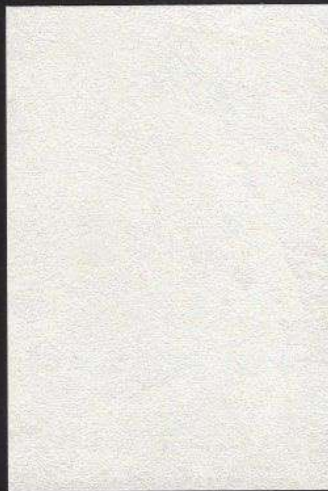
Eventi® Silver 4660 (base) Effetto Damasco