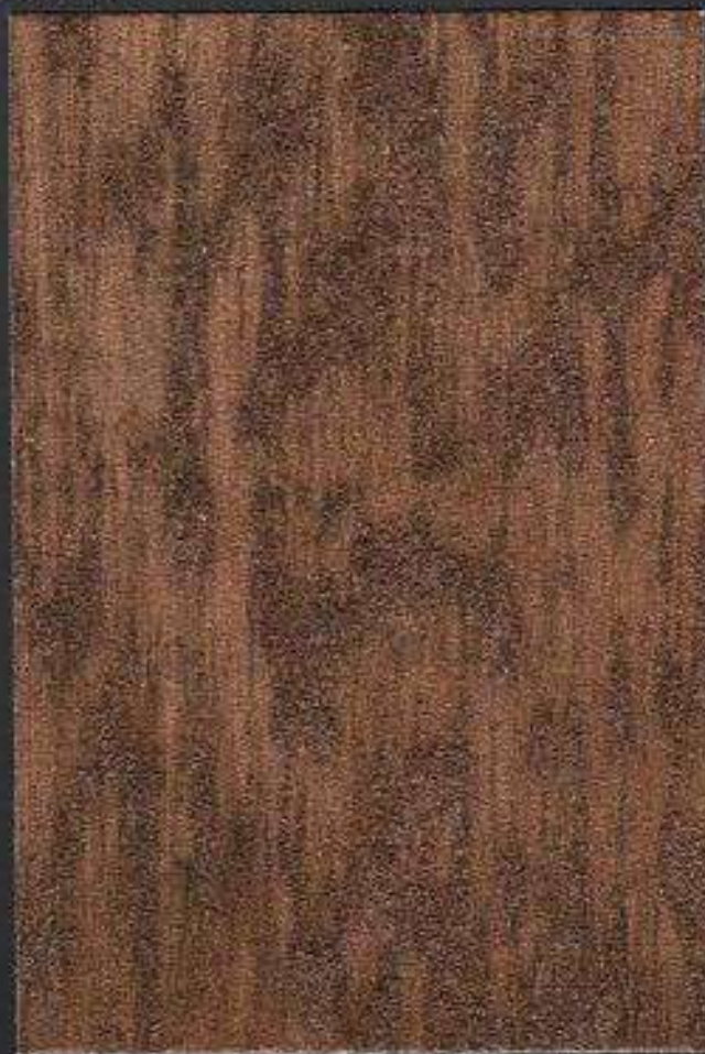
Spiagge Gold 4655 + Eventi® Classic 4620 Effetto Filato