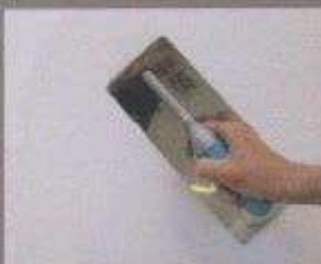
Risatura con Plastic Tip A Leveling with Plastic Tip A