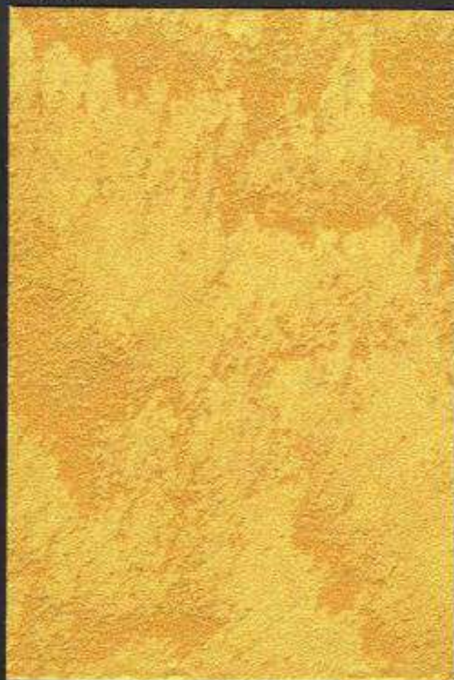
Spiagge Gold 4630 Effetto Taffetà